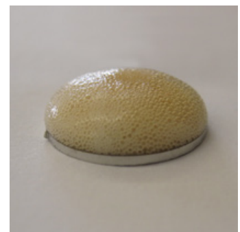
3b. Vista lateral de la reacción positiva que produce BioFinder al entrar en contacto con un biofilm