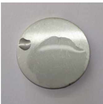
1. Superficie de acero inoxidable humedecida con agua

Basta con pulverizar BioFinder sobre las superficies de la instalación para revelar de manera inmediata las zonas contaminadas mediante una simple inspección visual.