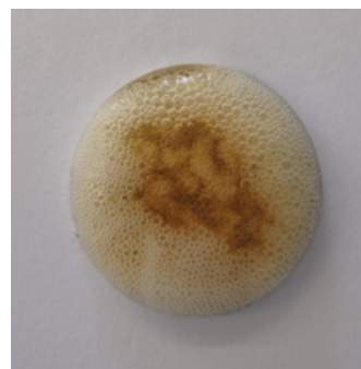
3. Reacción positiva al aplicar BioFinder sobre una superficie contaminada con biofilms